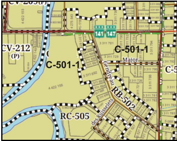
Délimitation des zones avant modification